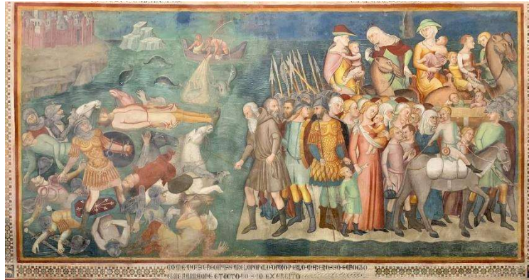
Figura 1: Scenes from the Old Testament (1367)