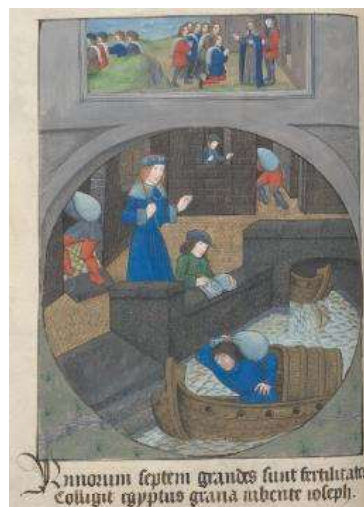
Figura 2: Bíblia figurata, pars I; Bernardus Guidonis, Nomina discipulorum Domini

Outras representações neste estilo estão presentes na Bíblia figurata, pars I, escrita por Bernardus Guidonis (1261-1331), na qual são descritas cenas da vida de José, filho de Jacó, no Egito (figura 2). Neste mesmo manuscrito ilustrado, há a presença da mesma cena citada anteriormente, a travessia do Mar Vermelho (figura 3). Destaca-se, mais uma vez, uma europeização das vestimentas e da aparência geral dos egípcios e dos hebreus, e até do espaço geográfico visto nos fundos das obras.