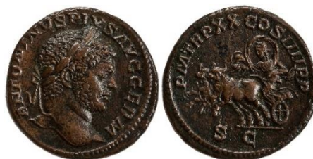
Asse de Caracala. Data: 217 d.C. American Numismatic Society. Proveniência: Roma. Peso: 9,97 gramas. Número de registro: 1954.203.236.