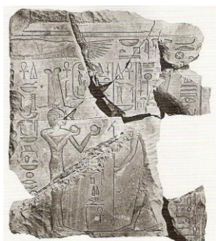
Figura 1: Hatshepsut fazendo oferenda ao deus Amon Fonte: (ROEHRIG apud SOUSA, 2010, p. 80)

e masculinos. Já no período de seu reinado e até o fim deste, é representada de forma totalmente masculinizada. Dessa forma, para a escolha das imagens de Hatshepsut, que serão analisadas, foram considerados os aspectos que a mulher-faraó utilizou para legitimar o seu reinado e a sua origem divina, além das variações de suas imagens acima explicitadas.