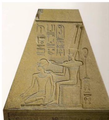
Figura 2: Hatshepsut sendo coroada por Amon-Rá Fonte: (MALEK apud SOUSA, 2010, p. 81)

Consoante a perspectiva de Sousa (2010), nesta imagem de um relevo também encontrado no templo de Amon, em Karnak, e datado de 1479-1458 a.C., Hatshepsut é retratada sendo coroada por seu pai, Amon-Rá. Na figura, Hatshepsut (com traços totalmente masculinos) usa o saio shendyt (tipicamente masculino) e o deus Amon-Rá coloca a coroa azul ( kepres ) em sua cabeça, além de estender os braços sobre a mulher-faraó formando o símbolo do ka , que significa a força da vida dos deuses, concedendo-lhe o “poder-vida”. Dessa forma, tal imagem retrata a legitimação do reinado de Hatshepsut e de sua origem divina pelo principal deus cultuado pela XVIII dinastia, Amon-Rá. Demais, outro aspecto importante da figura é a inscrição do nome de trono de Hatshepsut, Maatkare , Maat é o Ka de Rá , que demonstra que a antiga regente se tornou o faraó do Egito.