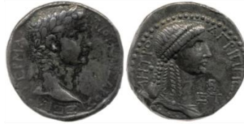
Fig.06. Tetradrachma, 211 of silver, AD 37 – 38, Antiochia ad Oronten, Turkey. Obverse: Caligula, ΓΑΙΟΥ ΚΑΙΣΑΡΟΣ ΣΕΒΑ ΓΕΡΜΑ, transliteration: GAIΟΥ KAISAROS SEBA GERMA. Reverse: Agrippina Maior ΑΓΡΙΠΠΕ[ΙΝΗΣ ΑΝΤΙΟ] ΜΗΤΡΟ and transliteration: AGRIPPE[INES ANΤΙΟ] ΜΕΤΡΟ. 212