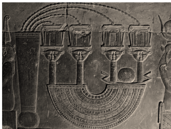
Figura 5: Colar Menat na Cripta do Templo de Dendera.