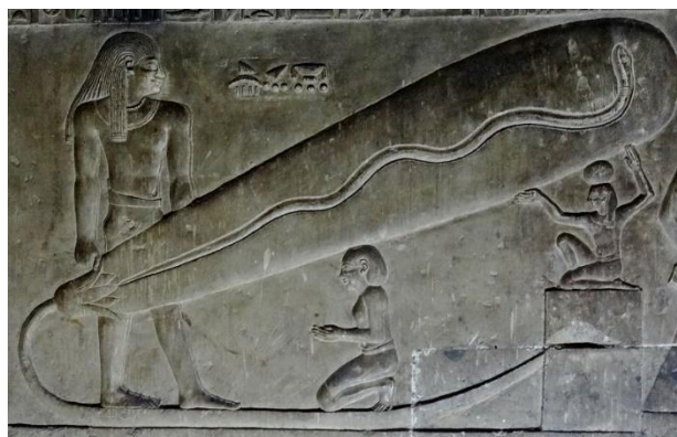
Figura 3: “Bulbo de Dendera” na passagem subterrânea, local mais reservado do Templo principal, acervo de mistérios dos sacerdotes.

Uma intensa conexão com o céu. No teto, o céu é uma deusa (Nut) e um mar de possibilidades e potencialidades. O que é maior que o céu? Um tamanho imensurável e sua importância colocada na condição de uma mulher, seu corpo envolvendo a terra, os homens e os deuses. Os deuses navegam nas ondas celestiais durante o brilho da lua e das estrelas que estavam no mesmo momento no horizonte surgindo com o pôr do sol até o seu nascer. A estrela mais brilhante do céu, Sirius, chamada de Ísis, apareceu na época de inundação das águas do Rio Nilo, trazendo alimento a sociedade como alimenta seu filho. Tudo está em movimento. A luz solar nascida da deusa Nut, aquece o terraço e passa por pequenas e estreitas aberturas, espalhando-se com muita intensidade, dando vida às rochas, pinturas, ao corpo e a todos os seres.