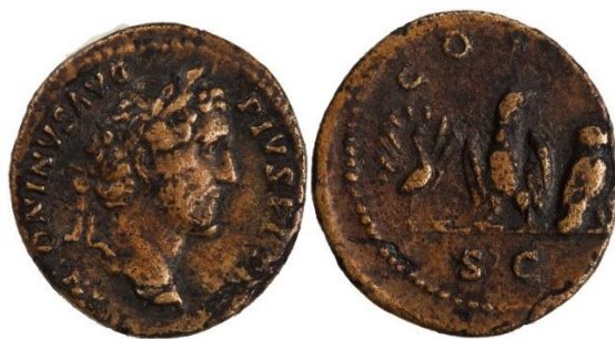
Quadrante de Antonino Pio. Data: 140-142 d.C. American Numismatic Society. Proveniência: Roma. Peso: 2.55 gramas. Diâmetro 19 mm. Número de Registro: 1946.7.15.

Na mitologia, o pavão era a ave sagrada de Juno. Segundo a narrativa de Ovídio a ave de Juno era aquela que levava cem olhos como joias brilhantes em sua cauda 72 . Varro cita a existência de pavões na gruta de Juno na ilha de Samos (De Re Rustica III, 6). E aqui, um dado que é caro a essa pesquisa: a associação de Juno com o pavão pode ser documentada como uma referência grega, já que existem moedas helênicas do início do império nas quais o obverso possui uma imagem de pavão e o anverso traz o rosto de Hera (TOYNBEE, 1973, p. 251). No caso das moedas das imperatrizes romanas, entretanto, o atributo divino partilhado com Juno não é adicionado para representar um elemento particular de uma divindade.