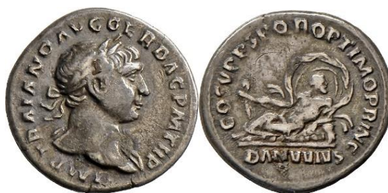
Denário de Trajano. Data: século II d.C. Landesmuseum de Württemberg. Proveniência: Roma. Dimensões: Diâmetro: 18 mm. Peso: 2,95 gramas. Número de registro: MK 20392.

O denário romano de Trajano (século II d.C.) é certamente um exemplo, dentre os homens, bastante pungente dessa aproximação. Nele, é a própria imagem do imperador no anverso, que se aproxima de uma divindade masculina com a velificatio no reverso. Ainda assim, mesmo a associação da figura de Danúbio com a do próprio imperador não está clara em um sentido que seja possível afirmar que por extensão a velificatio também pode ser associada à Trajano.