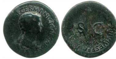
Fig.08. Sestertius 219 of copper alloy, Rome, AD 80 – 81, Titus' government. Obverse: Agrippina, A[GRIPPINA] M F GERMANICI CAESARIS (Agrippina Mater Filii Germanici Caesaris 220 = Agrippina mother of the children of Germanicus Caesar 221 ). Reverse: SC (Senatus Consultum = minted with the consent of the Senate) and [IMP T CAES] DIVI VESP F AVG [P M TR P P P COS VIII] (Imperator Titus Caesar Divi Vespasianus Fili Augustus Pontifex Maximus Tribunicia Potestate Pater Patriae Consul Octavum 222 = Emperor Caesar Titus, Son of the Divine Vespasian Augustus, Maximum Pontiff with Tribune Power, Father of the country and Consul for the Eighth Time 223 ). 224