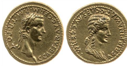
Fig. 05. Aureus, 206 Rome, AD 37 – 38. Obverse: Caligula, C CAESAR AVG GERM P M TR POT (Gaius Caesar Augustus Germanicus Pontifex Maximus Tribunicia Potestate 207 = Gaius Caesar Augustus Germanicus Pontiff Maximum with court power 208). Reverse: Agrippina the Elder, AGRIPPINA MAT C CAES AVG GERM (Agrippina Mater Caius Caesar Augustus Germanicus = Agrippina mother of Gaius Augustus Germanicus 209). 210