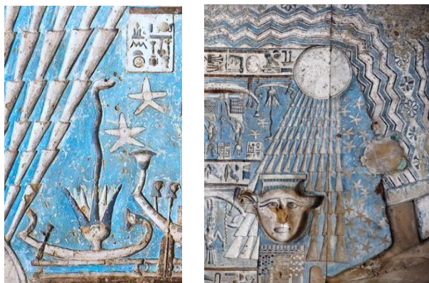
Figura 1: Detalhes no teto do salão hipostilo. Cor azul resguardada no Templo de Dendera. Figura 2: Deusa Hathor na irradiação solar difrativa nascendo do ventre da Deusa Nut (Céu).