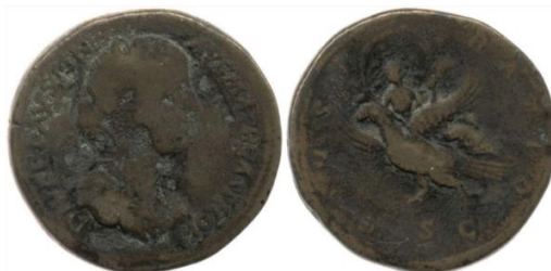
Sestércio de Faustina II. Data: 176-180 d.C. British Museum. Proveniência: Roma. Peso: 26,71 gramas. Número de registro: 1860,0326,29.

Nas moedas relativas as imperatrizes, é possível perceber a importância da velificatio em um arranjo iconográfico que as mencionam junto à consecratio . No reverso das moedas não há nenhuma indicação a alguma deusa específica, mas uma imagem que