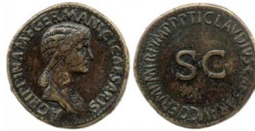
Fig.07. Copper alloy sestertius 213 , AD 50 – 54, Claudius' government. Obverse: Agrippina the Elder, AGRIPPINA M F GERMANICI CAESARIS (Agrippina Mater Filii Germanici Caesaris 214 = Agrippina mother of the children of Germanicus Caesar 215 ). Reverse: SC (Senatus Consultum = minted with the consent of the Senate), TI CLAVDIVS CAESAR AVG GERM P M TR P IMP P P (Tiberius Claudius Caesar Augustus Germanicus Pontifex Maximus Tribunicia Potestate Imperator Pater Patriae 216 = Emperor Tiberius Claudius Caesar Augustus Germanicus, Pontifical Maximus, with court power and father of the country 217 ). 218