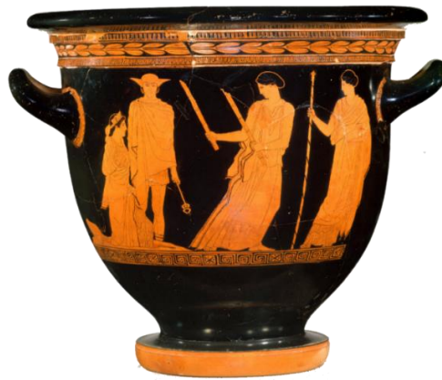
Figura 1: Vaso cerâmico terracota bell-krater intitulado "Retorno de Perséfone". Pintado por Persephone Painter. Grécia Atica, datado em 440 a.C.

Na cena do vaso, aplicamos o método de Claude Calame (1986) para a leitura semiótica de imagens que pressupõe a necessidade de analisarmos os jogos de olhares dos personagens nas cenas registradas nos vasos cerâmicos. Neste caso, observamos que Hermes é o único que está posicionado de uma maneira diferente das outras personagens presentes no vaso. Nesse sentido, entende-se, de acordo com o arcabouço metodológico proposto por Claude Calame, que Hermes se encontra em posição frontal, que significa que o personagem convida o receptor a participar da ação representada no vaso. Adiante, na imagem, notamos a presença de Demeter aguardando Hermes conduzir sua filha Perséfone do mundo de Hades ao mundo dos vivos.