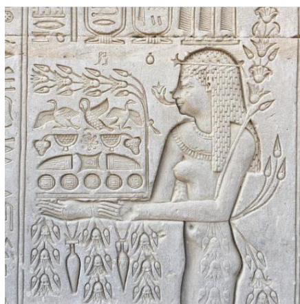
Figura 4: A arte e conhecimento no cultivo do alimento, prevalecendo os vegetais em Dendera.

Ó, criança, o amor que inspiras está sobre ti (...). O Nilo é emanação de teu corpo, que alimenta os nobres e o povo, ó, Senhor do Sustento, governante das plantas verdes, o grande, árvore da vida que dá oferendas aos deuses (...). (ARAÚJO, 2000, 363)