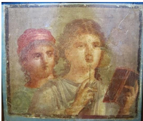
Imagem 5: Meninas com estilete e tabuinha. Século I d.C., IV estilo. Museu Arqueológico Nacional de Nápoles. Número de inventário: 9074. Fonte: https://commons.wikimedia.org/wiki/File:Fanciulle_che_scrivono_messaggi_d%27amore_(IV_stile),_I_sec._da_pompei,_MANN_9074.JPG . Acesso em: 20 abr. 2021.

segura um estilete, o qual dirige a sua boca. A figura feminina logo atrás parece observar com atenção o que realiza a moça a frente.