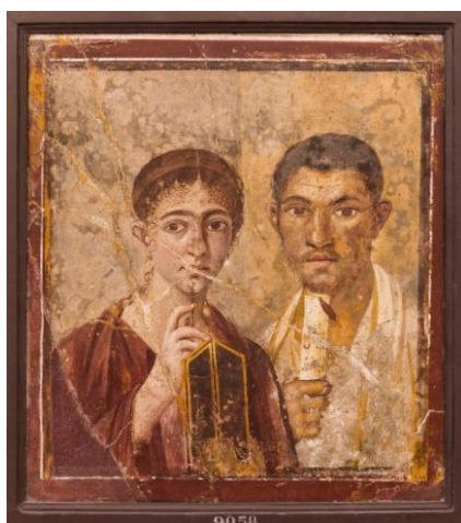
Imagem 4: Terentius Neo e sua esposa. Século I d.C., IV estilo. Museu Arqueológico Nacional de Nápoles. Número do inventário: 9058.

imagem chegou a ser interpretada como uma formalidade, posto que, por ser o retrato de um casal, era necessário ficar explícito que se tratava da esposa do padeiro (SANFELICE, 2011, p. 187-189).