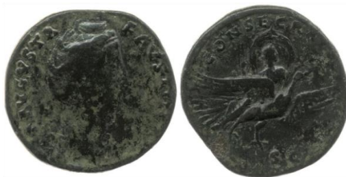
Dupôndio de Faustina I. Data: 141-161d.C. British Museum. Proveniência: Roma. Peso: 10,35 gramas. Número de registro: 1938,0313,9.

Dessa forma, portanto, no século I em Roma, a qualidade divina explicitada pela velificatio é o resultado do seu uso massivo e quase exclusivo por divindades e não por pessoas. No século II, as moedas comemorativas de Sabina (135 d.C) e Faustina I (também conhecida como Faustina a Velha ou Faustina Maior) (141-161d.C.) nos mostram um estado diferente da situação. O uso da velificatio continuará em moedas posteriores, num esquema compositivo muito similar nas moedas de Faustina II, a Jovem, (176-180 d.C.).