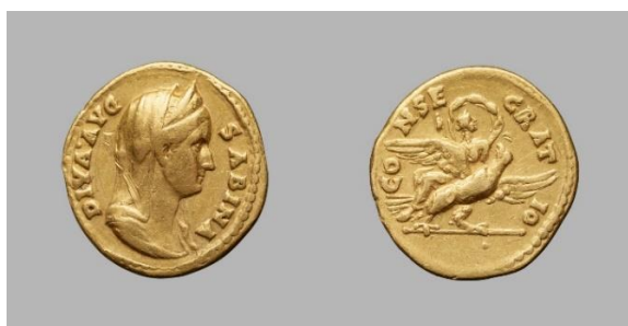
Áureo de Sabina. Data: 135 d.C. Yale University Art Gallery. Dimensões: 19,4 mm. Peso: 7,27 g. Número de registro: ILE2013 .17.96.