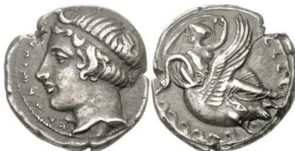
Didracma de Kamarina. American Numismatic Society. Data: 415-405 a.C., Proveniência: Sicília. Peso: 8,20 g. Número de Registro: 135728

alguma forma tenha constituído o ambiente visual que deu origem a sua produção imagética. Em comum elas partilham o mesmo veículo: o numismático, a mesma pose, o mesmo movimento de ascensão e também a velificatio .