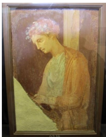
Imagem 2: Mulher leitora. Século I d.C., IV estilo. Museu Arqueológico Nacional de Nápoles. Número de inventário: 8946.

A imagem 2 representa uma mulher com coroa de folhas nos cabelos, presos em um penteado. Apesar da deterioração da pintura em sua base, é possível perceber que a moça direciona o seu olhar para baixo e segura nas mãos um objeto que não pode ser identificado de forma adequada, mas que aparenta ser um livro, pergaminho ou tabuinha. A imagem 3 segue a mesma temática, ao trazer uma mulher com vestes suntuosas, que mesclam tons de branco e laranja, bem como apresenta um pergaminho em mãos, para qual direciona a sua visão, numa clara representação do ato de ler.